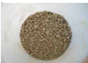
武蔵プラント製造品