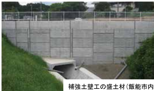
補強土壁工の盛土材（飯能市内）