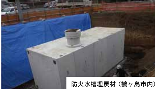
防火水槽埋戻材（鶴ヶ島市内）