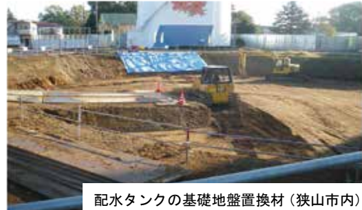
配水タンクの基礎地盤置換材（狭山市内）